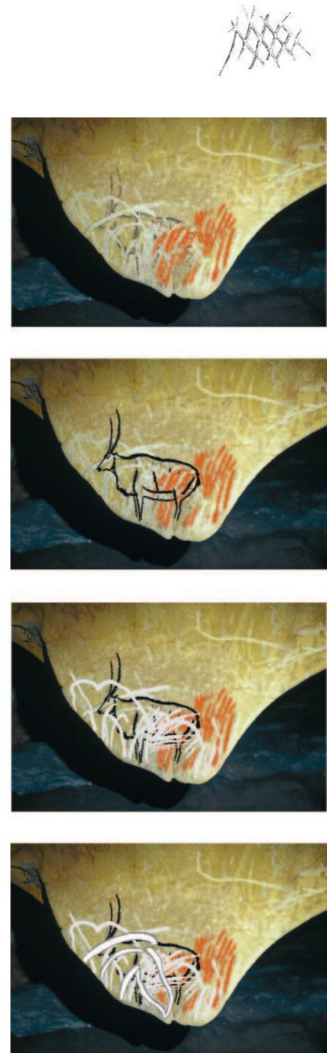
Fig. 10 - Salle du Crâne. Chronologie relative du pendant au Daguet (doc. Carole Fritz & Gilles Tosello d'après Baffier et Feruglio)

Im Salle du Crâne zeigt das "Panneau du pendant au Daguet" eine von der soeben genannten Abfolge verschiedene Sequenz [Abb. 9, 10]: