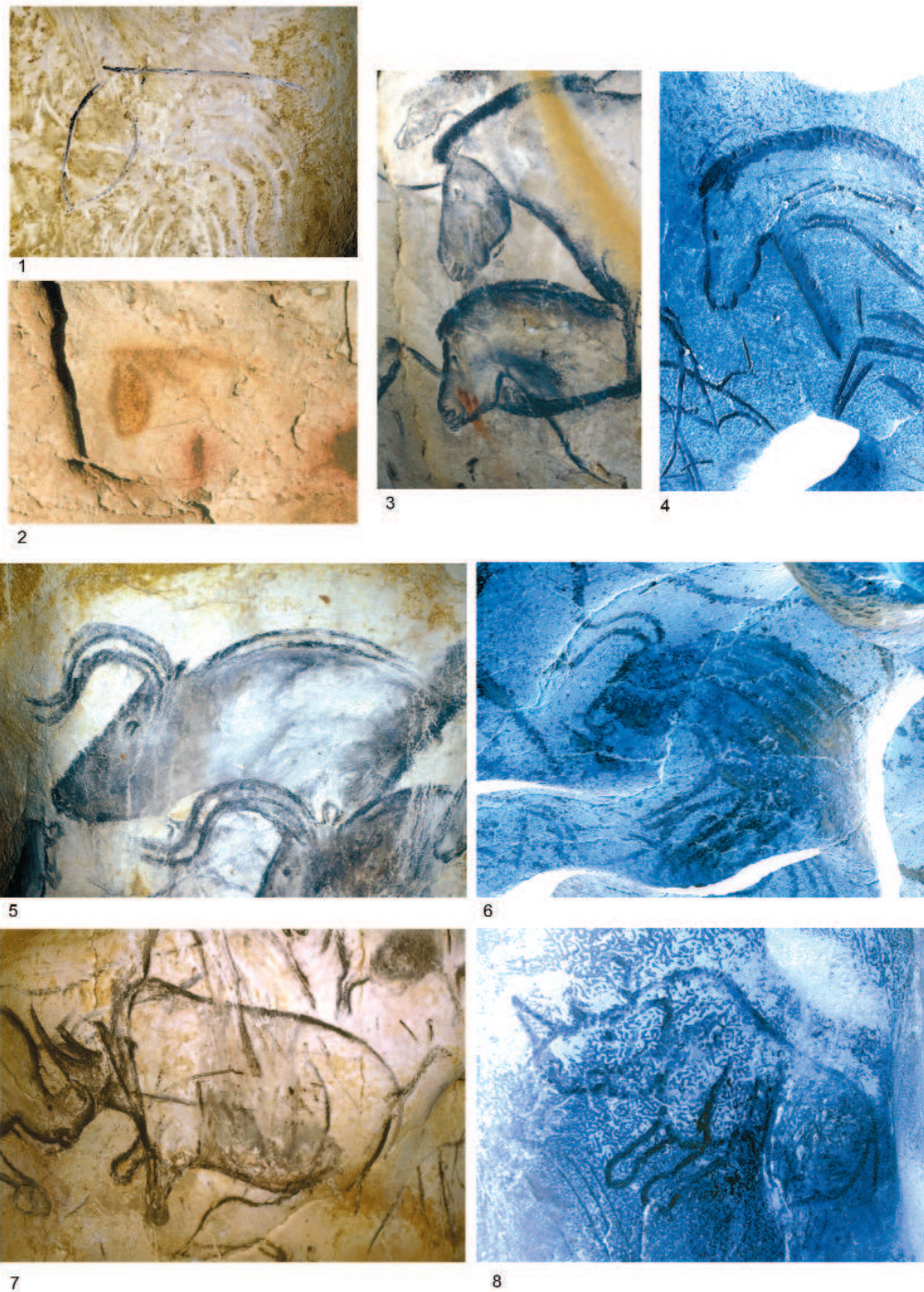
Abb. 12 - Die technische Diversität schließt nicht ein gemeinsames Formenvokabular aus, egal welche Tierart betroffen ist. Die Bilder auf blauem Grund wurden einer Bildbearbeitung (in Negativform) unterzogen; die gravierten Konturen, in Realität weiß, erscheinen hier dunkel schattiert. Dies erlaubt einen besseren Vergleich mit den schwarzen Zeichnungen und den Malereien.

1-2 Zwei stilisierte Pferdeköpfe, der eine in Holzkohle ausgeführt (Salle du Crâne), der andere mit gelbem Pigment (Salle Brunel).