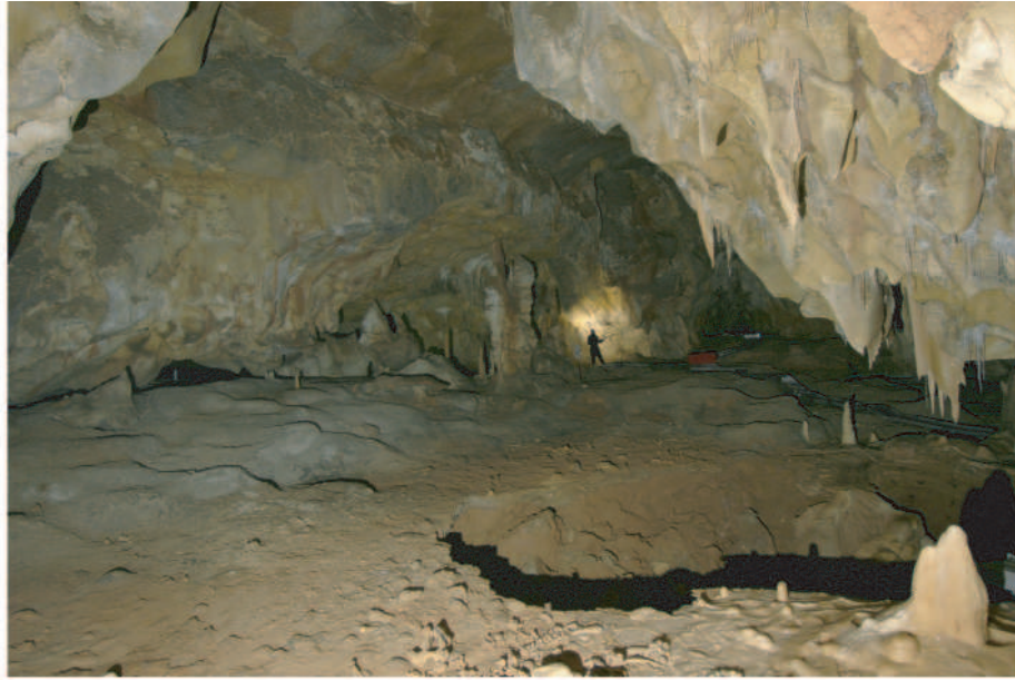
Vers la Galerie des Croisillons

Das Panneau des gravierten Pferdes ist ohne Zweifel das bestimmende Ensemble des Südteils des Saales (Abb. 3). Im rechten Teil des Panneaus erkennt man zwei ineinander