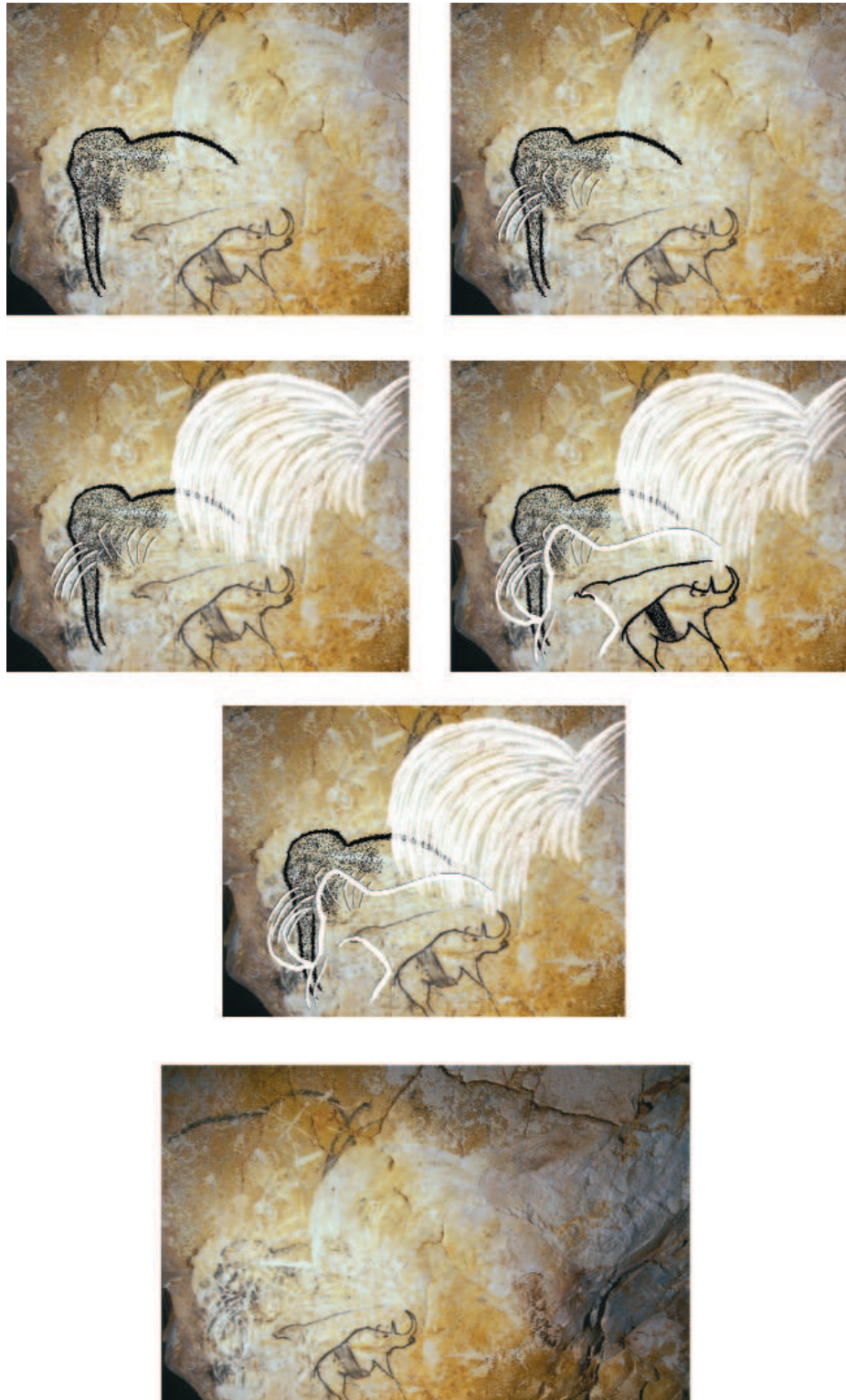
Fig. 11 - Galerie du Mégacéros. Chronologie relative du panneau du rhinocéros à l'entrée de la galerie en paroi gauche (doc. Carole Fritz & Gilles Tosello d'après Baffier et Feruglio)

Der kleine schematische Pferdekopf des Salle du Crâne, der einen Aurochs überlagert, erinnert an die in Gelb oder Rot gemalten Equiden des Eingangsbereiches der Höhle (Salle Brunel) oder an die mit dem Kohlestift angerissenen Darstellungen von der Basis des Panneau der Rentiere (Salle Hillaire).