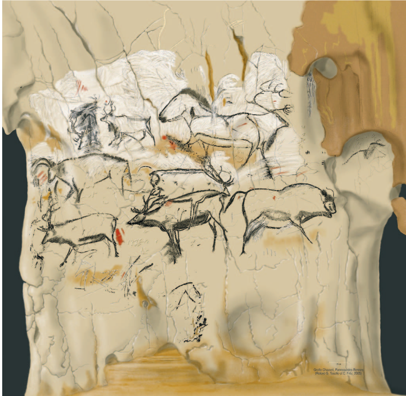
Fig. 6 - Secteur des Chevaux. Relevé d'ensemble du panneau des Rennes (doc. Carole Fritz & Gilles Tosello)

Abb. 6 - Sektor der Pferde. Nachzeichnung des Ensembles des Panneaus der Rentiere (Dokumentation Carole Fritz u. Gilles Tosello)